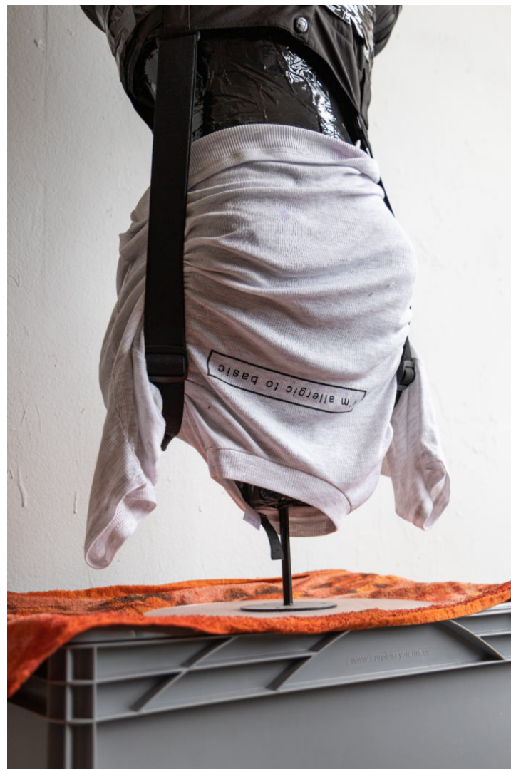
▲ Ohne Titel (I am allergic to basic) Schaufensterpuppe, Klebeband, Kleidungsstücke, Handtuch, Euroboxen Ca.60x200cm 2023