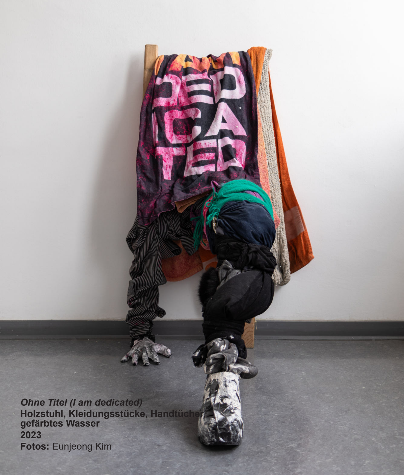
Ohne Titel (I am dedicated) Holzstuhl, Kleidungsstücke, Handtücher, gefärbtes Wasser 2023