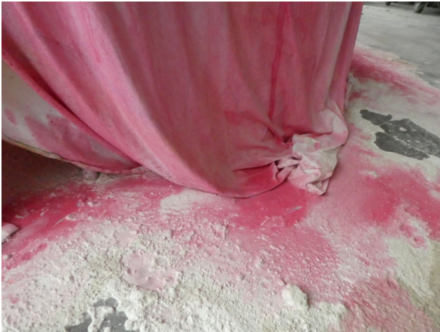
Ohne Titel (GEDANKENSPAZIERGANG-Steinsaal) Betttücher, Gips, Gouachfarbe, Wasser, Gerätschaften Steinsaal 2021