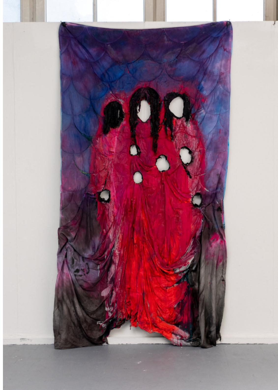
► Ohne Titel Bettdecke und Betttuch, Acryl-, Lack- und Sprayfarbe Ca. 230x 135cm 2022