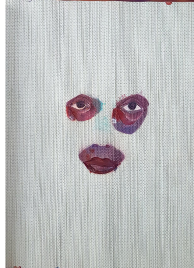
▲▶▶ Ohne Titel Tapetenmusterbuch, Acryl- und Sprayfarbe 2021