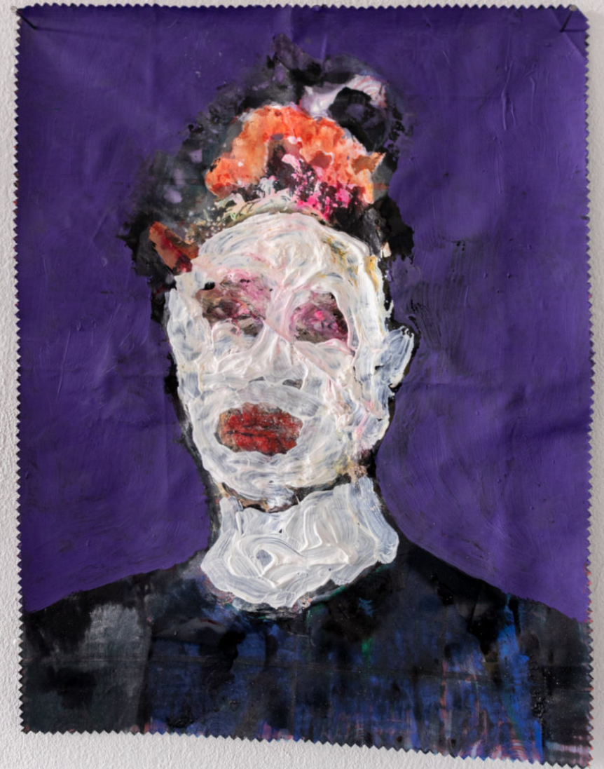
► Ohne Titel Farbe auf Stoff Ca. 30cm x 40 cm 2022