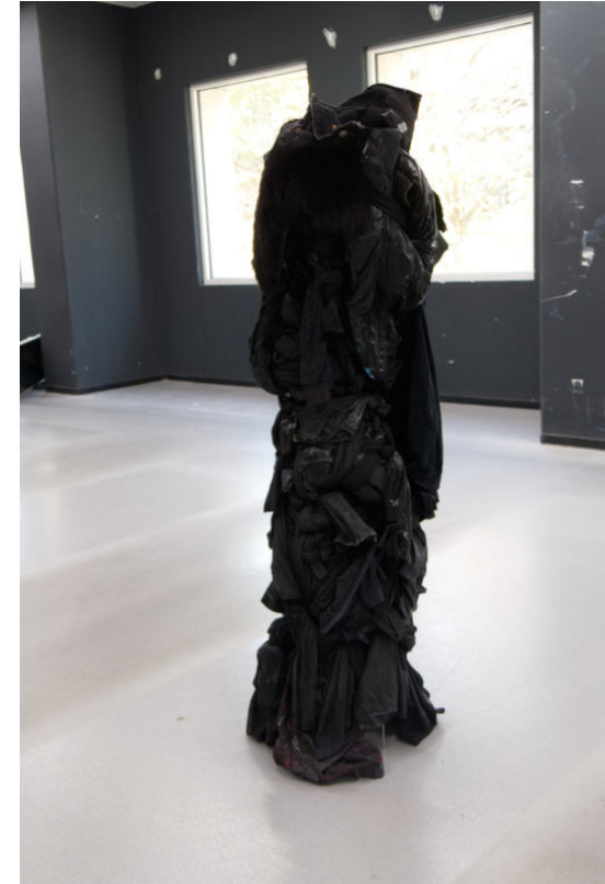
▶▶ Ohne Titel Kopfkissen, Effekt- und Sprayfarbe, gefärbtes Wasser 2022