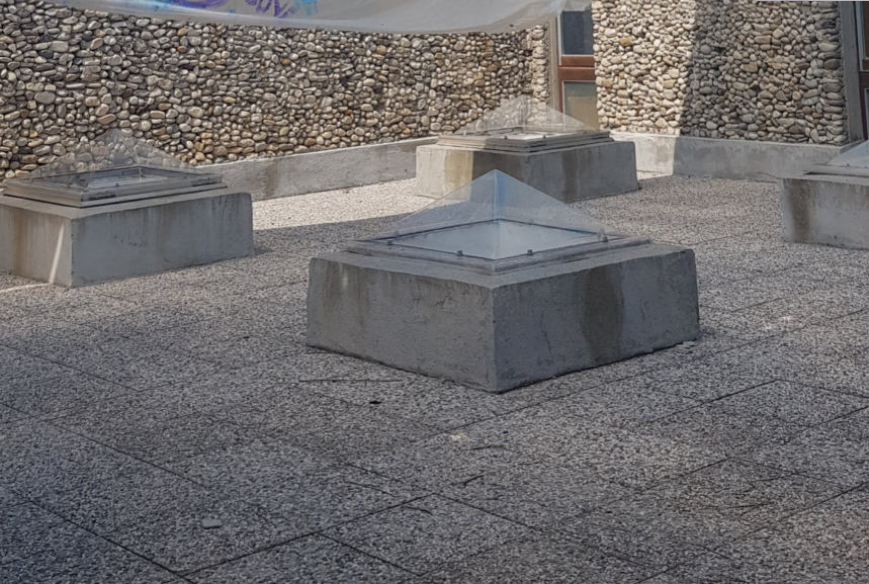
◀▲ POOLPARTY (Cooperation with Pavlos Ionnides Zum Journée de la fraternité an der Villa Arson, Nizza) Plastikfolie, Gouachfolie Ca. 8m x 15m 2019