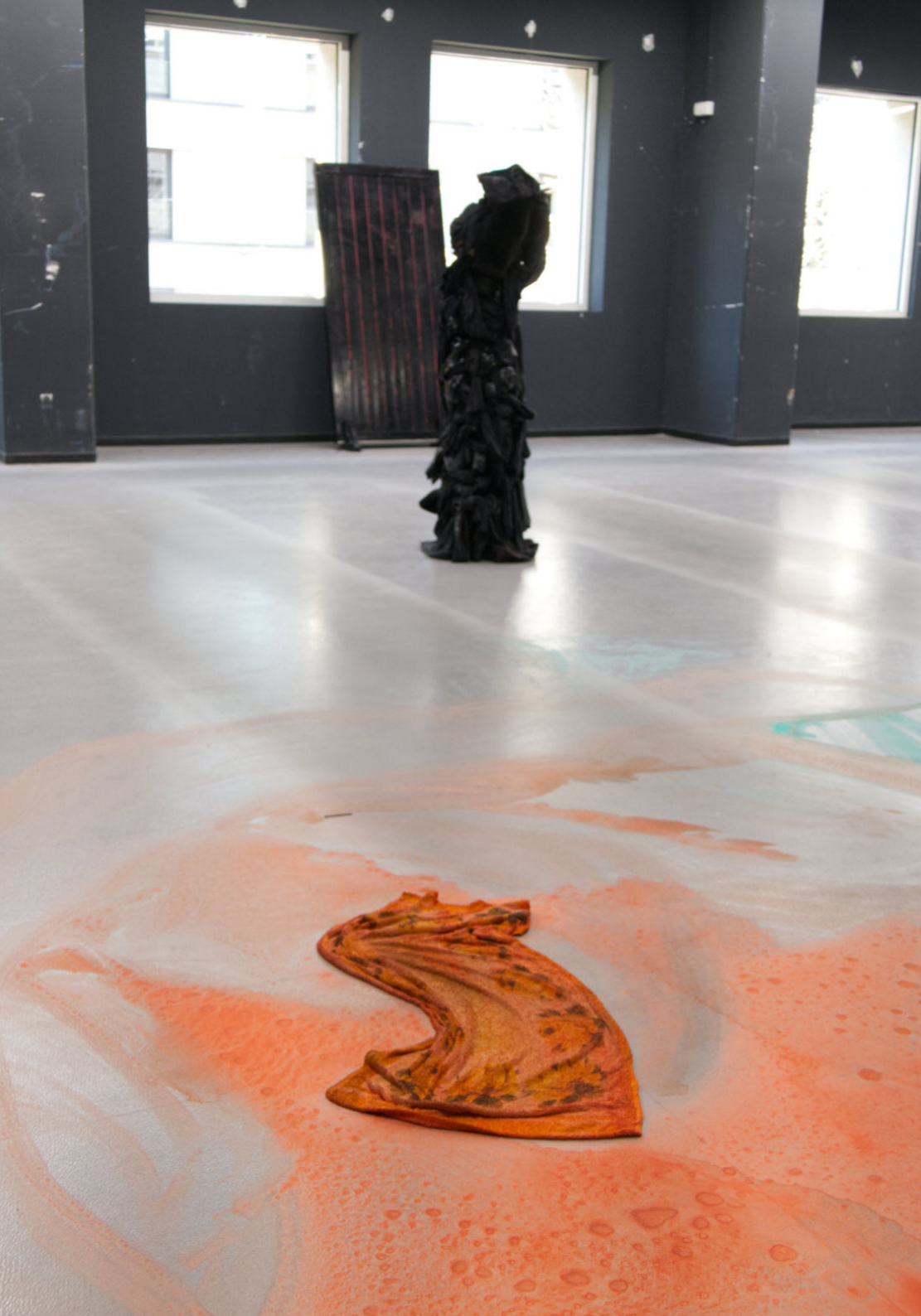
◀▲ Ohne Titel Klamotten, Lack, Rankhilfe Ca. 35 cm x 160 cm 2022