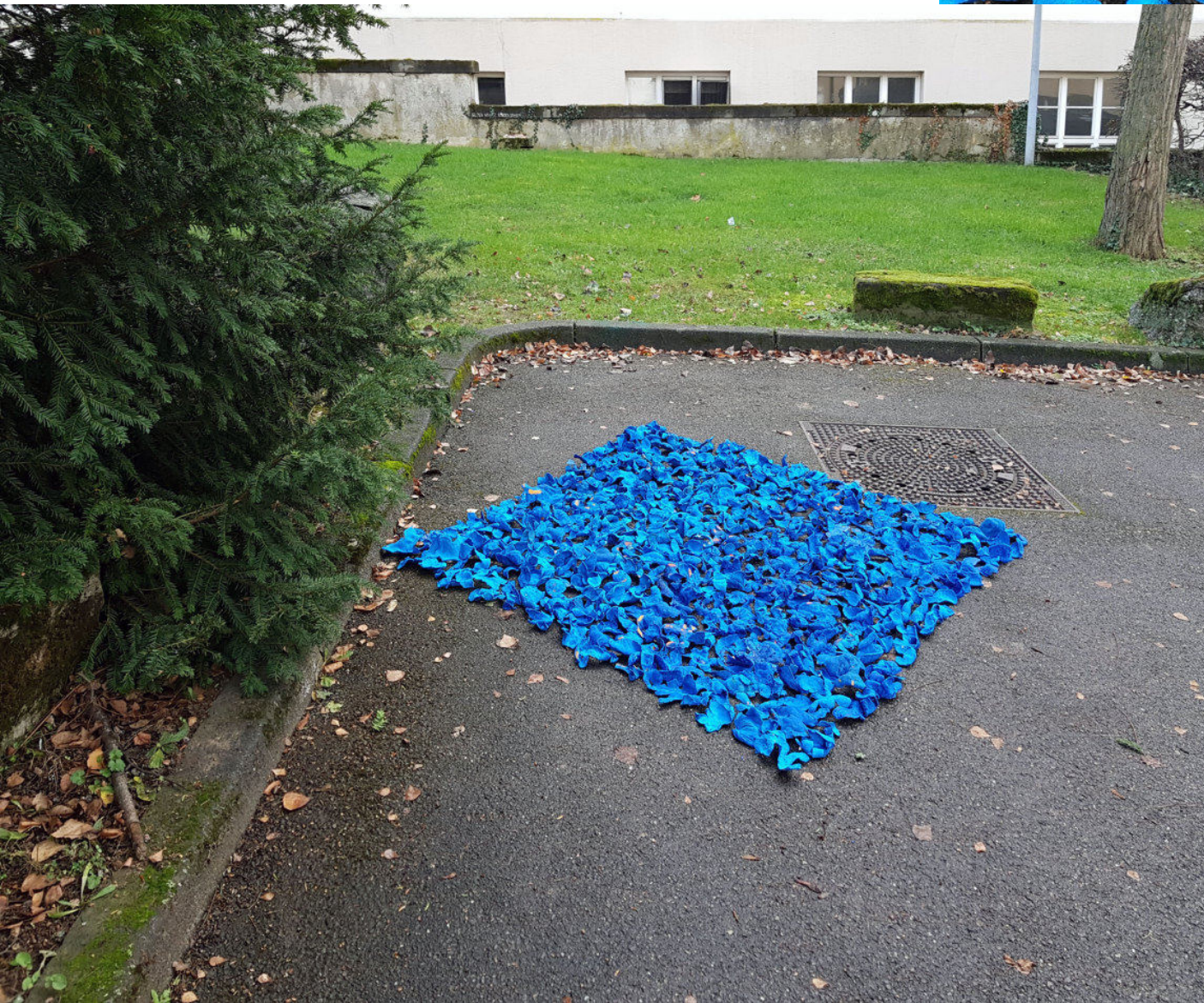
► ▼ Orange Square Orangenschalen, blaue Gouachfarbe 2021