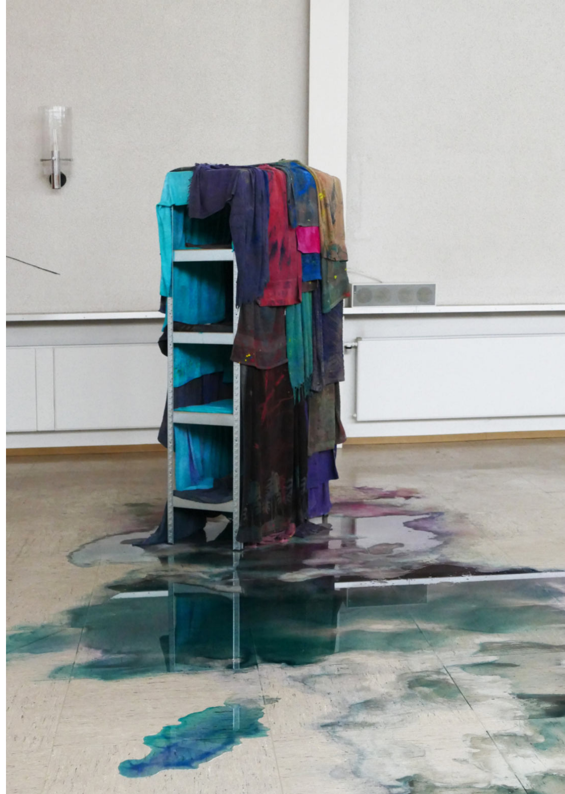
► Ohne Titel (HuMBase Stuttgart) Schwerlastregal, Handtücher, Gouachfarbe Ca. 180 cm x 90 cm x 45 cm 2020