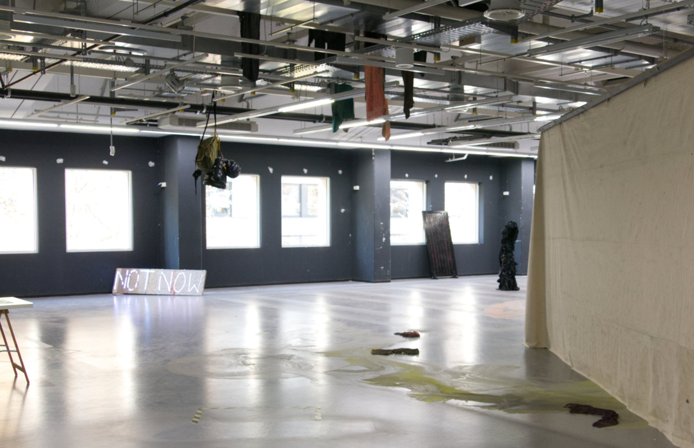
Ausstellungsansicht, Was macht eigentlich Konrad? Im ehemaligen Conrad Electronics 2022