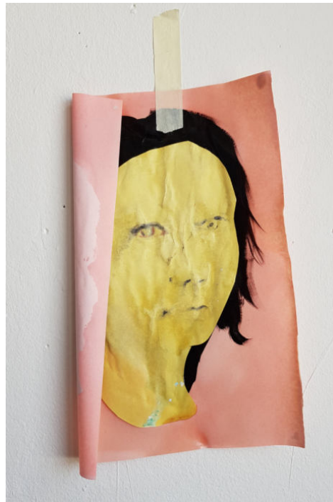
◀▲ Ohne Titel (Papierporträts, fortlaufende Serie) Farbe auf Papier ca. 30cm x 45 cm 2022