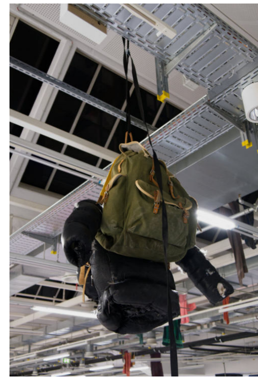
▲ ▲ Weltenbummler Winterjacke, Daunen, Wanderrucksack, Lack 2022