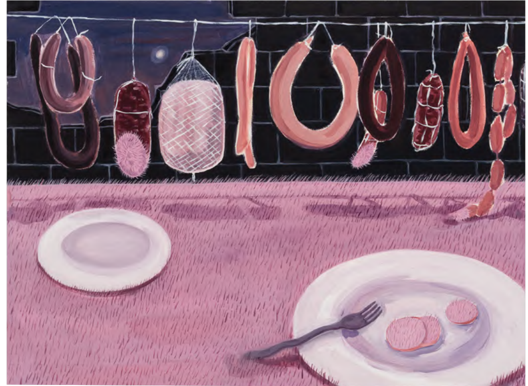
When Dawn Comes 2024