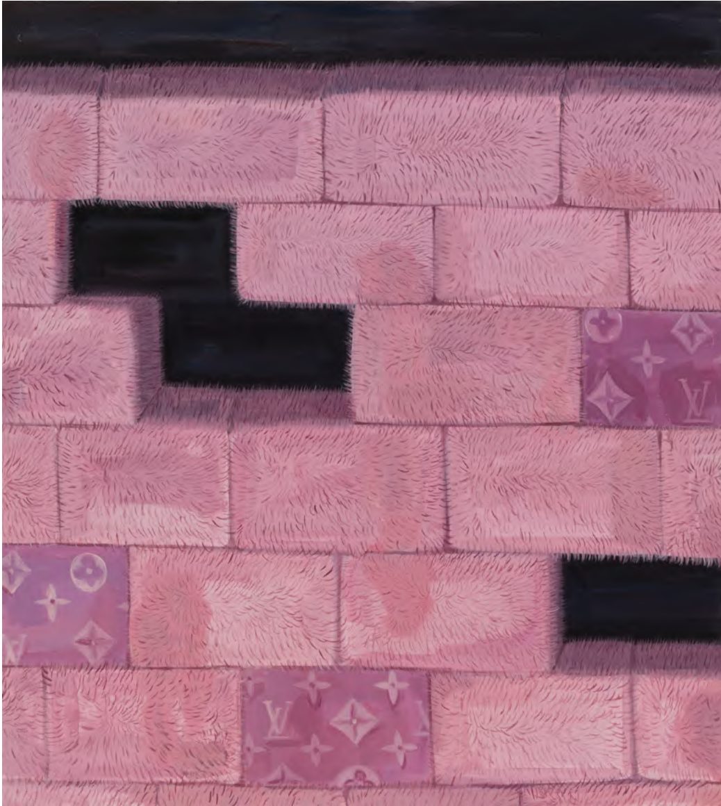
o.T. 2024 Öl auf Leinwand 145 x 125cm