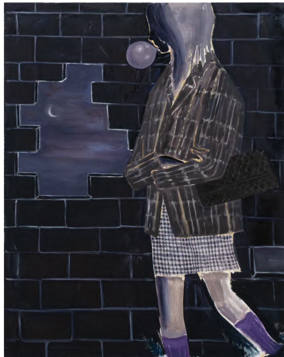
o.T. 2024 Öl auf Leinwand 120 x 100cm