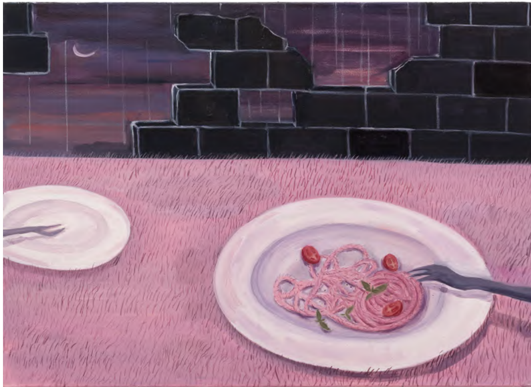
A Bowl of Spaghetti 2024