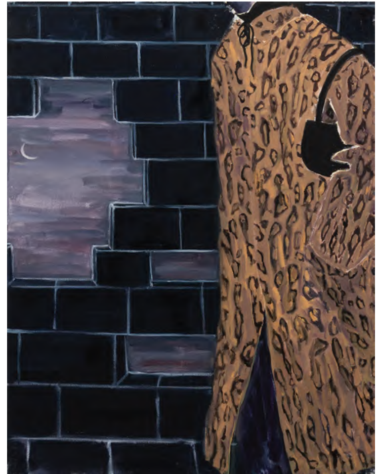
o.T. 2024 Öl auf Leinwand 95 x 80cm