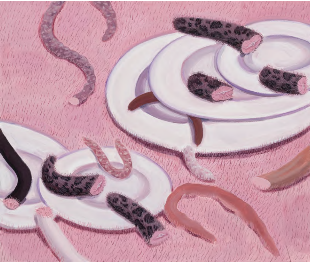
o.T. 2024 Öl auf Leinwand 85 x 100cm