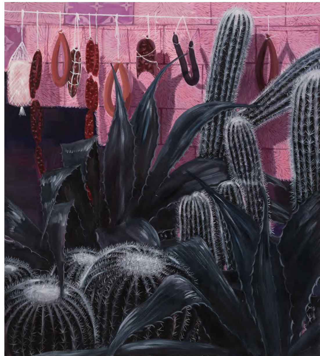
o.T. 2024 Öl auf Leinwand 145 x 125cm