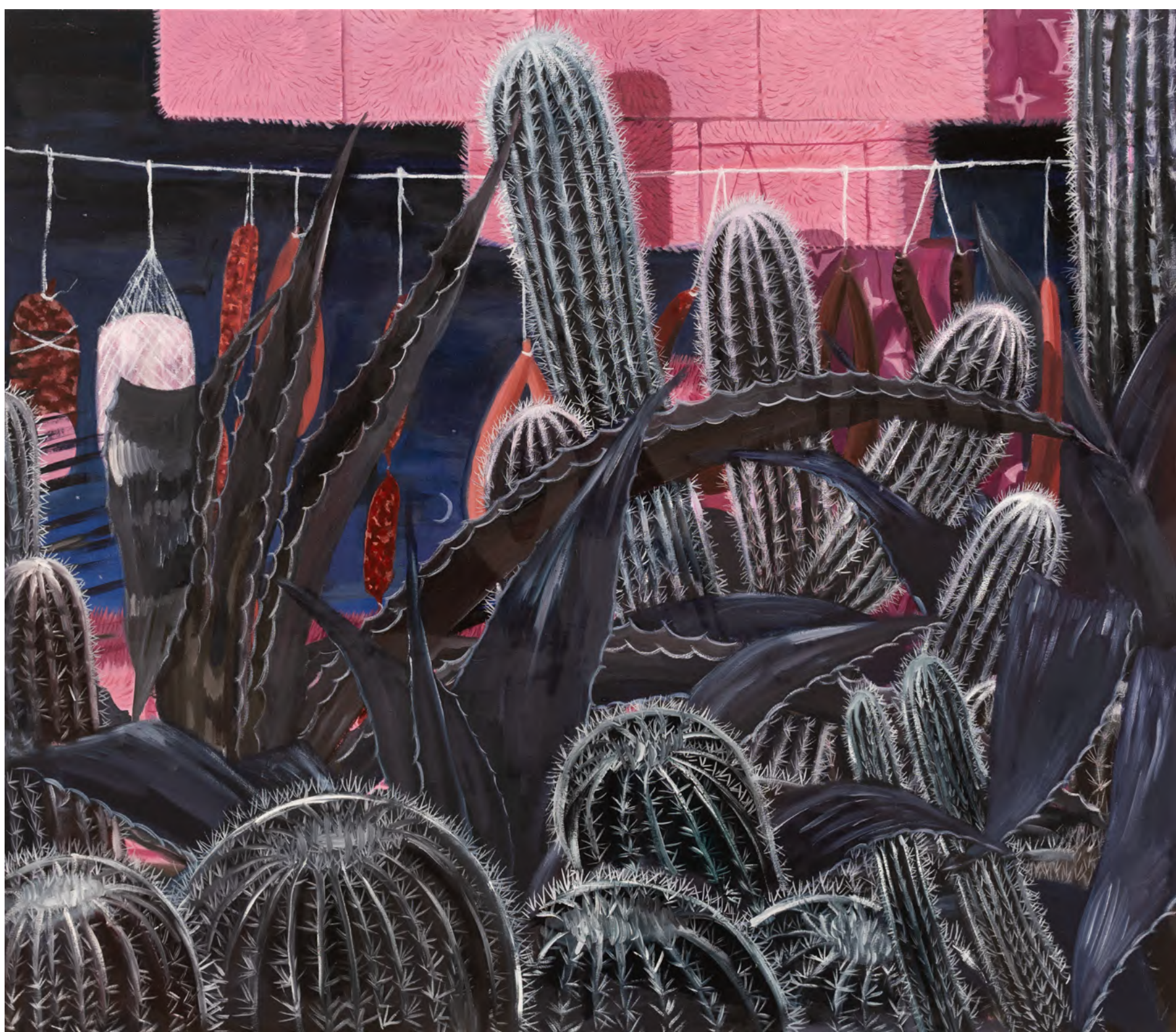
o.T. 2024 Öl auf Leinwand 130 x 155cm