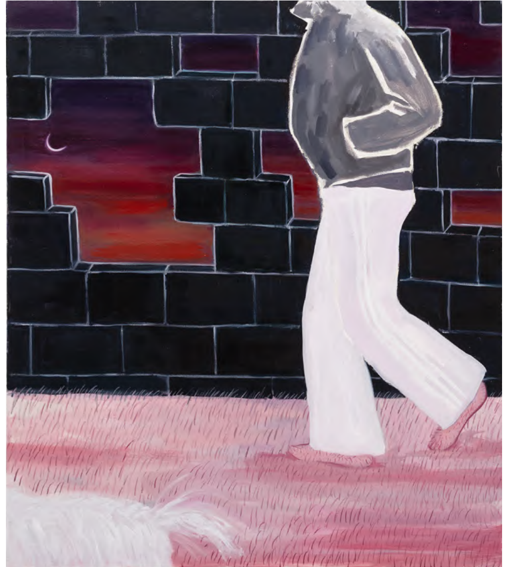
Set Off At Daybreak 2024 Öl auf Leinwand 145 x 125cm