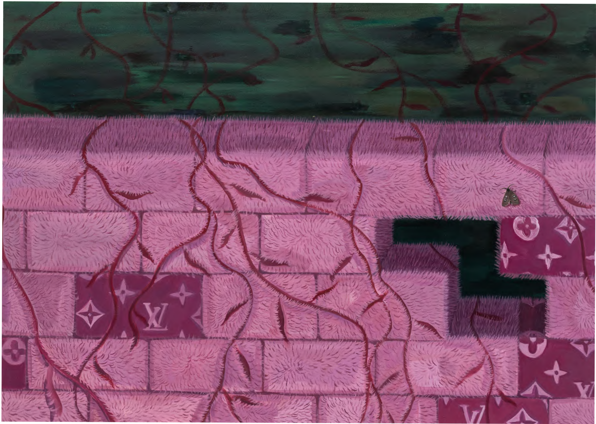
o.T. 2024 Öl auf Leinwand 100 x 145cm