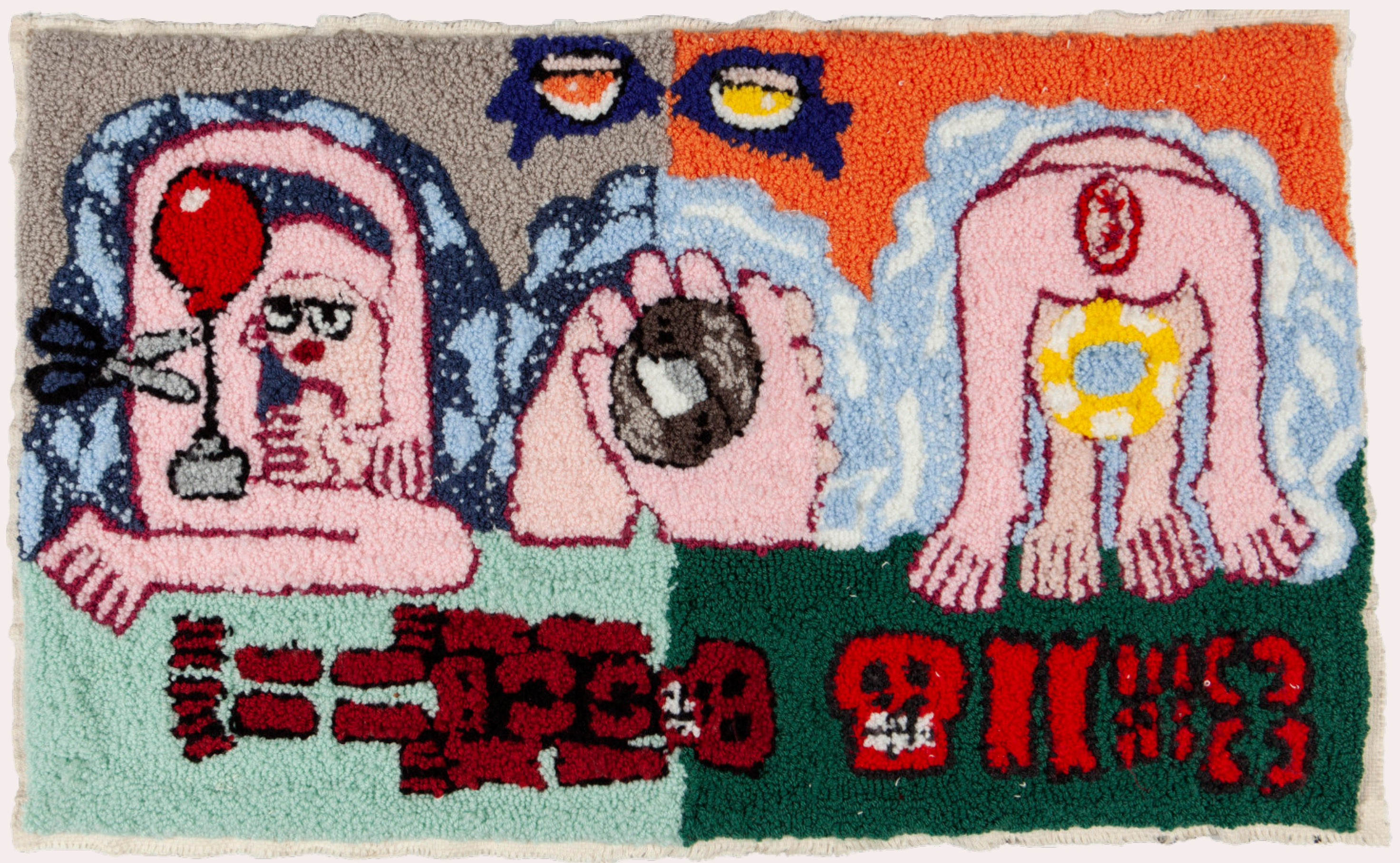
NACKTSCHECKEN SEX JAHR 2022