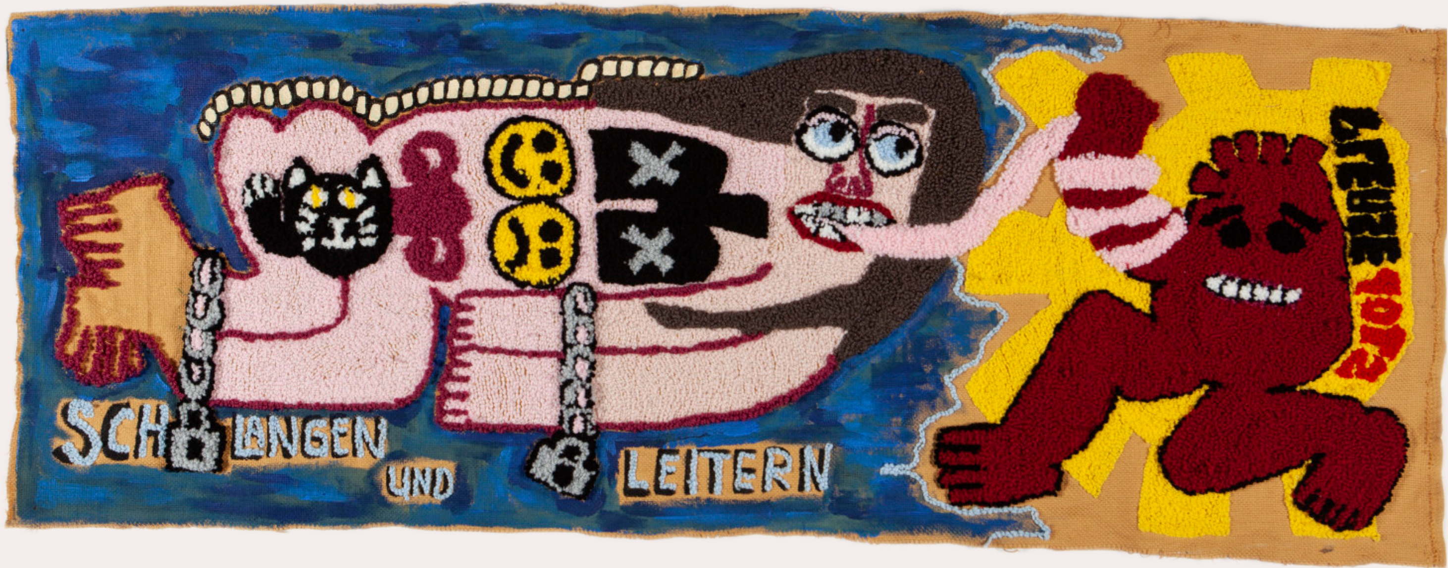
SCHLANGEN UND LEITERN JAHR 2022