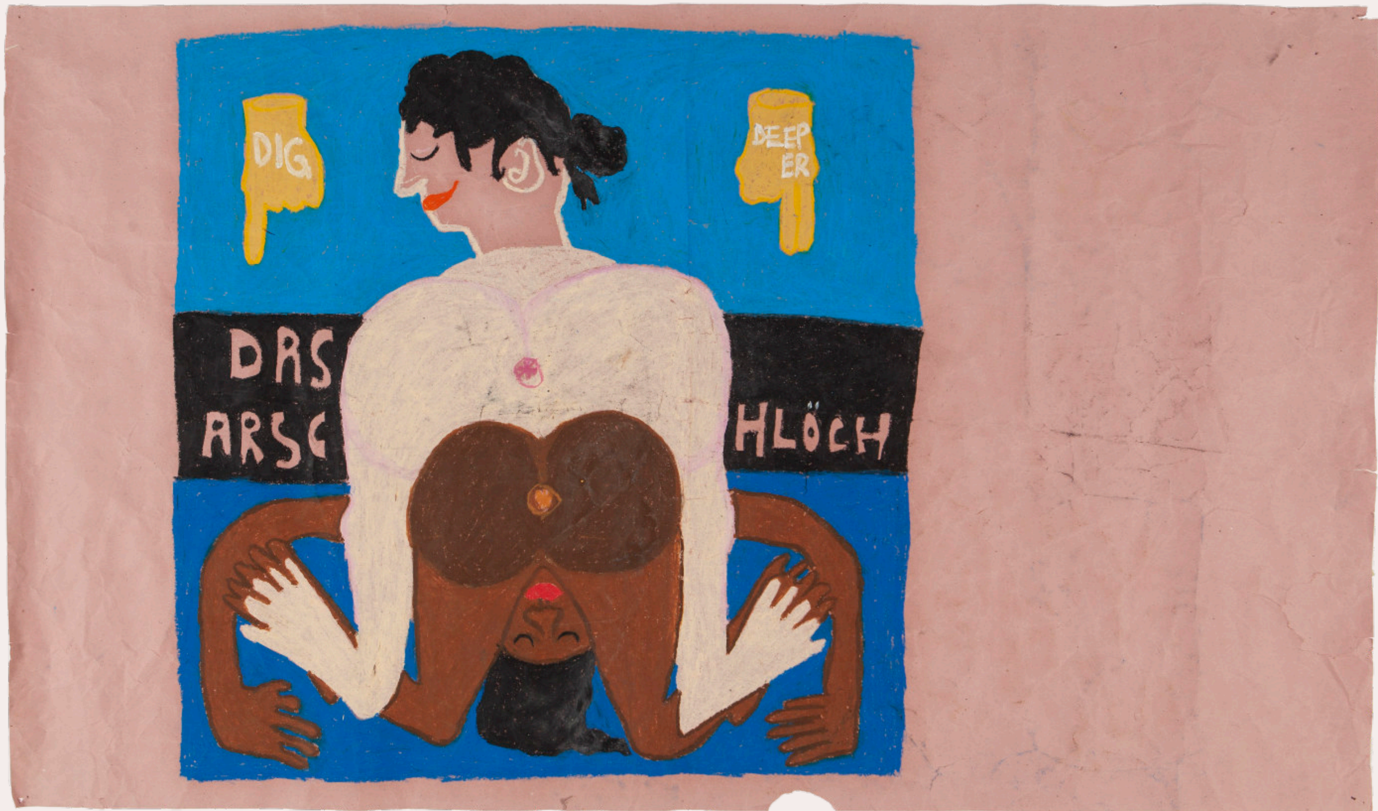
DAS ARSCHLÖCH JAHR 2020